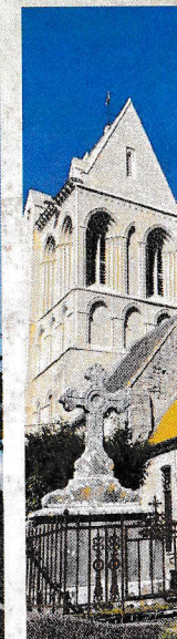
Église de Villiers le Sec