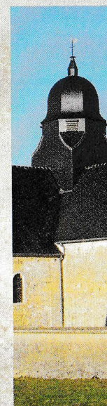
Église de Chouain