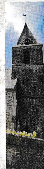
Église de Ste Croix-sur-mer