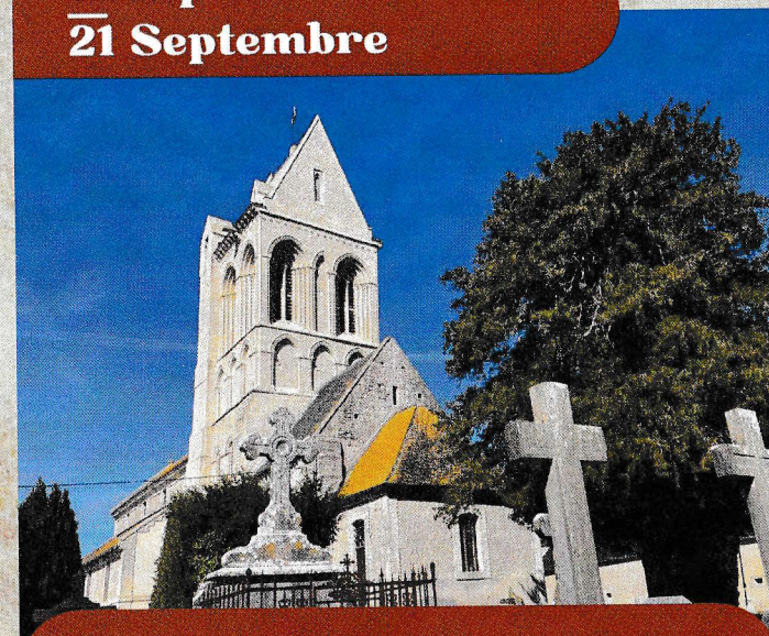
Église de Villiers le Sec